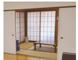
お付き添い(2F仮眠施設)